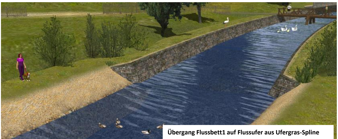
Übergang Flussbett1 auf Flussufer aus Ufergras-Spline

Die Böschung ist für den Einsatz im freien EEP-Gelände gedacht und nicht auf die Abmessungen eines bestimmten Böschungssplines festgelegt!