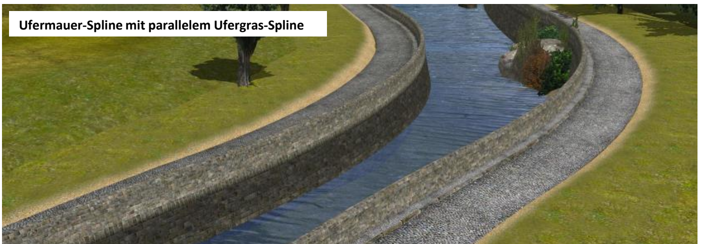
Ufermauer-Spline mit parallelem Ufergras-Spline

1.6 UM1BRK8m_LD1: Brückenteil mit Länge 8m mit beidseitigem Stirnabschlüssen der Geländermauern. Dieses Brückenteil kann sowohl quer als auch längs zur Ufermauer an Teil UM1BRA1 bzw. UM1BRA2L / R andockt werden. Dadurch können kleine Bäche bzw. Kanäle überspannt werden. Die Einsetzhöhe beträgt 5,0m auf Oberkante Fahrbahn