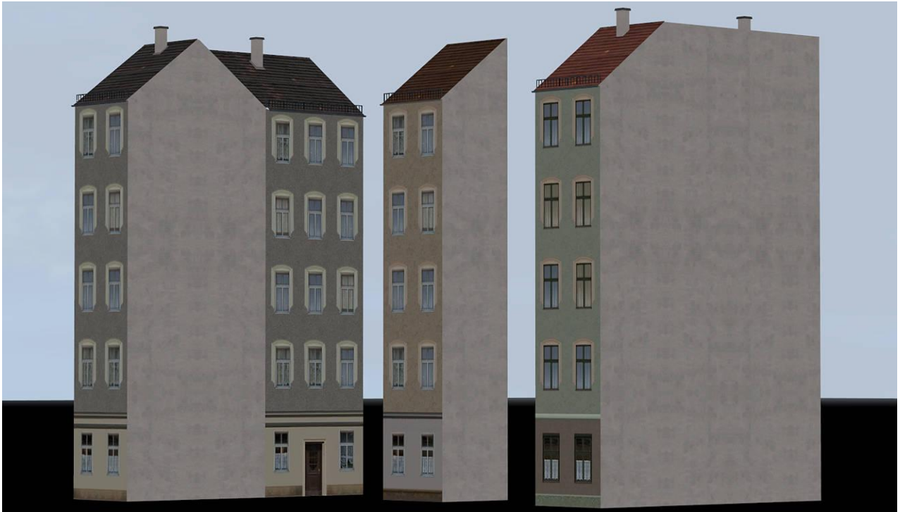
SR26_SHaus_li_3_AF1 (von links), SR26_SHaus_Mitte_5_AF1 und SR26_SHaus_re_1_AF1