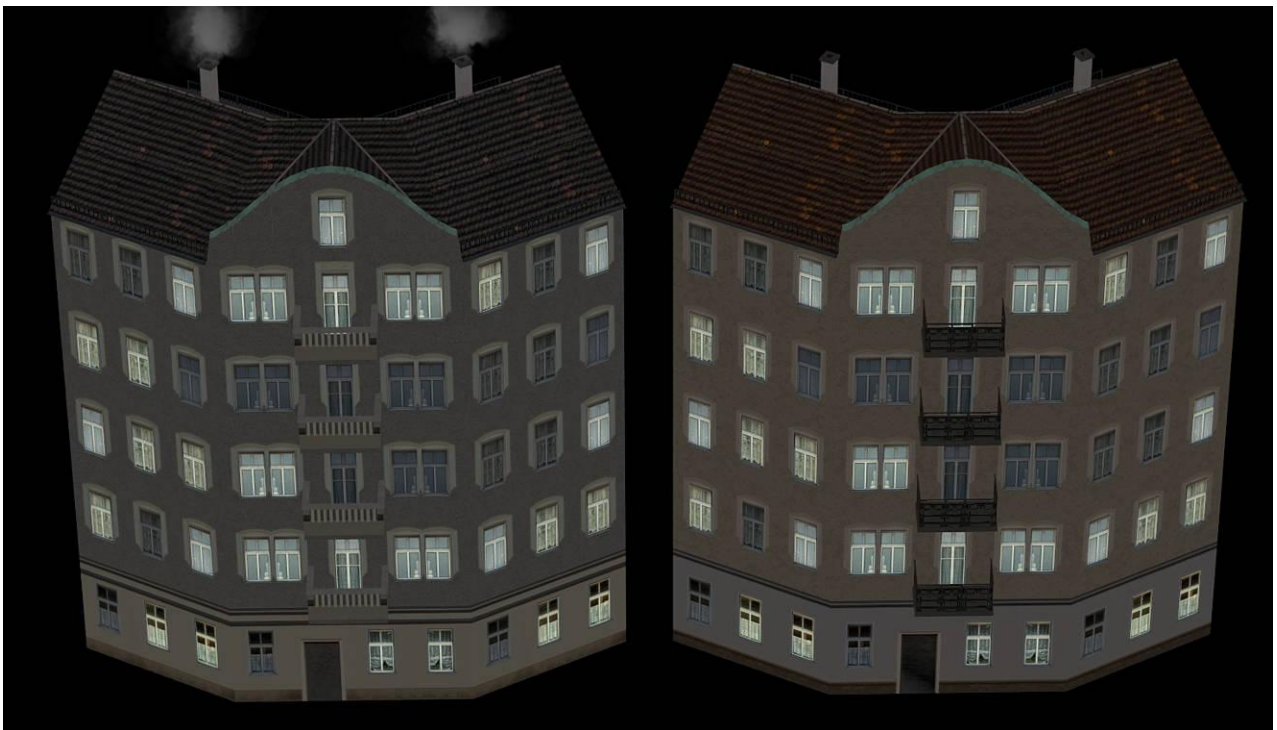
SR26_EHaus_L_3_AF1 (links) und SR26_EHaus_K_5_AF1 in der Nachtansicht