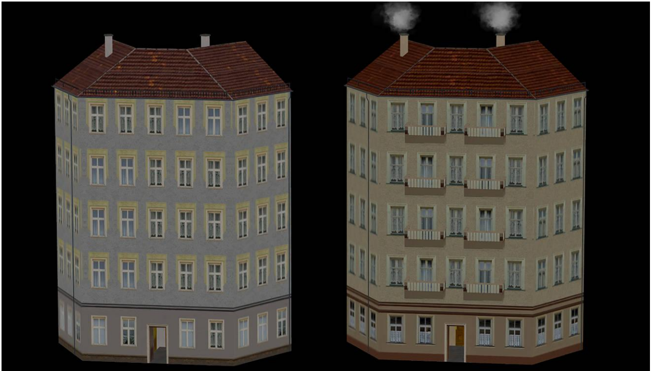
SR26_EHaus_A_4_AF1 (links) und SR26_EHaus_C_2_AF1