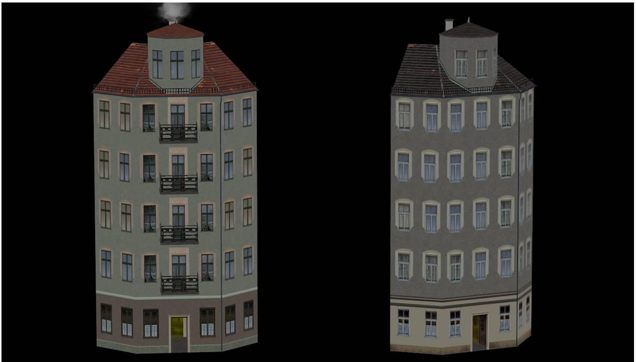
SR26_EHaus_E_1_AF1 (links) und SR26_EHaus_D_3_AF1