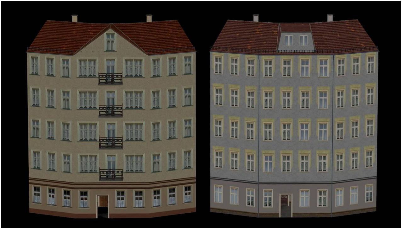
SR26_EHaus_H_2_AF1 (links) und SR26_EHaus_G_4_AF1