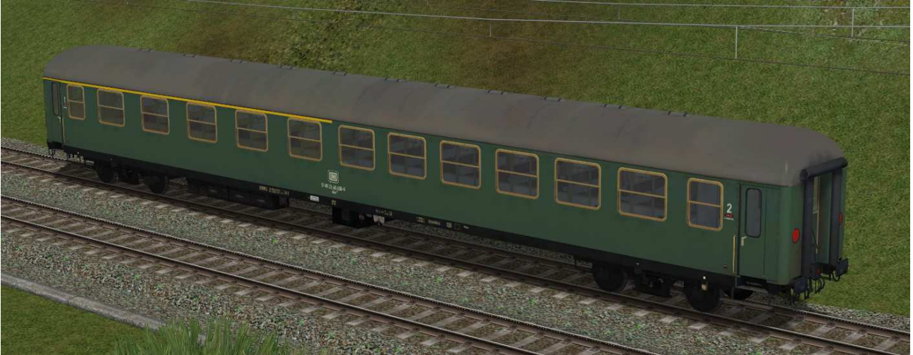
erste / zweite Klasse Reisezugwagen der Gattung ABm225 in EpIV