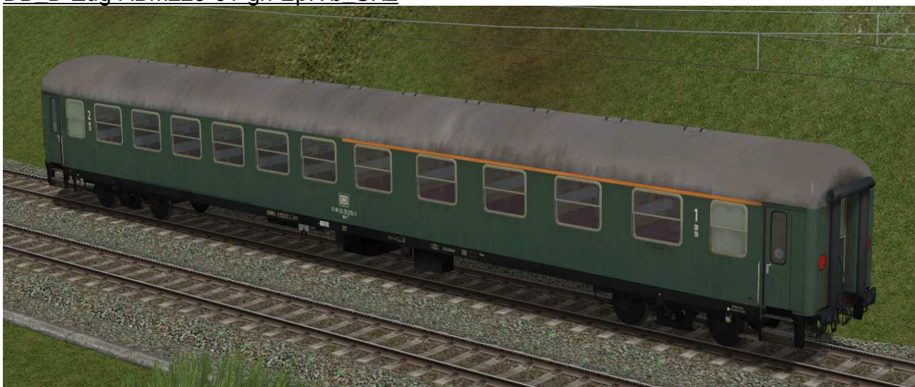
erste / zweite Klasse Reisezugwagen der Gattung ABm225 in EpIVb