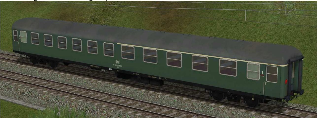
erste / zweite Klasse Reisezugwagen der Gattung Abüm223 in EpIVa