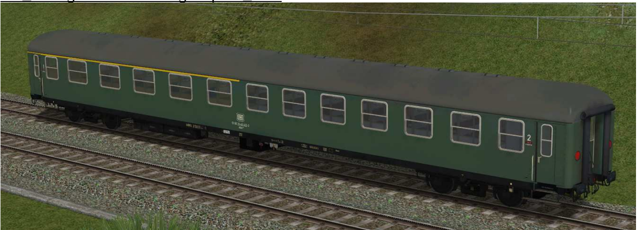
erste / zweite Klasse Reisezugwagen der Gattung Abüm224 in EpIVa