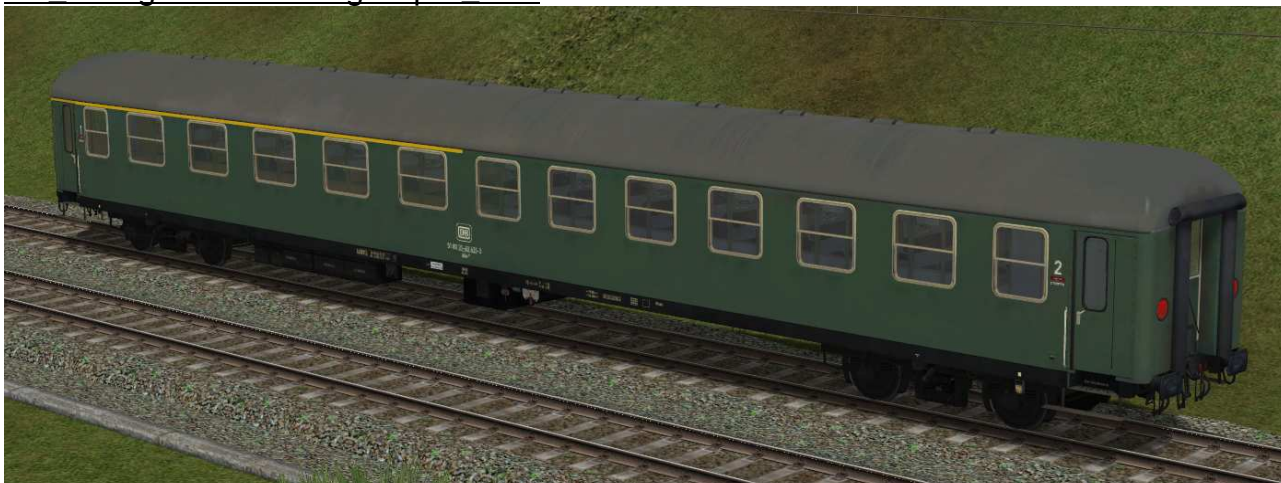
erste / zweite Klasse Reisezugwagen der Gattung ABm224 in EpIV