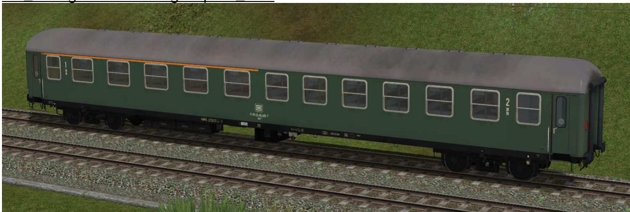
erste / zweite Klasse Reisezugwagen der Gattung ABm224 in EpIVb